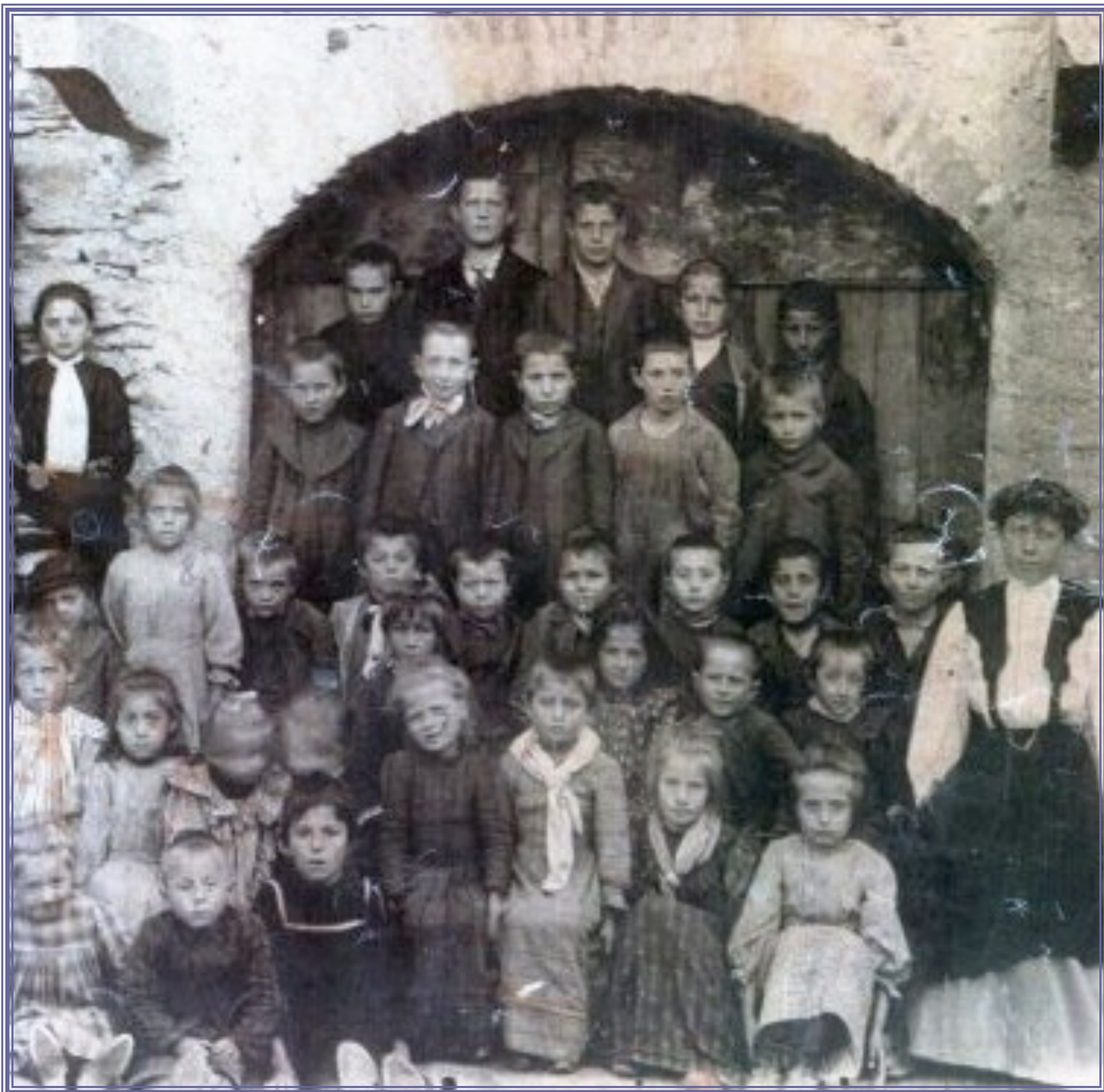
Gli alunni della scuola alle piccole Tanze. Foto del 1912.